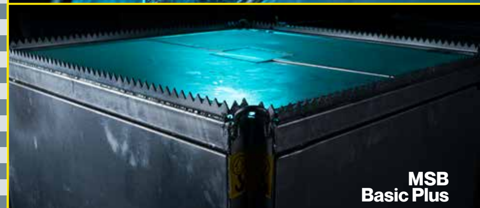
MSB Basic Plus